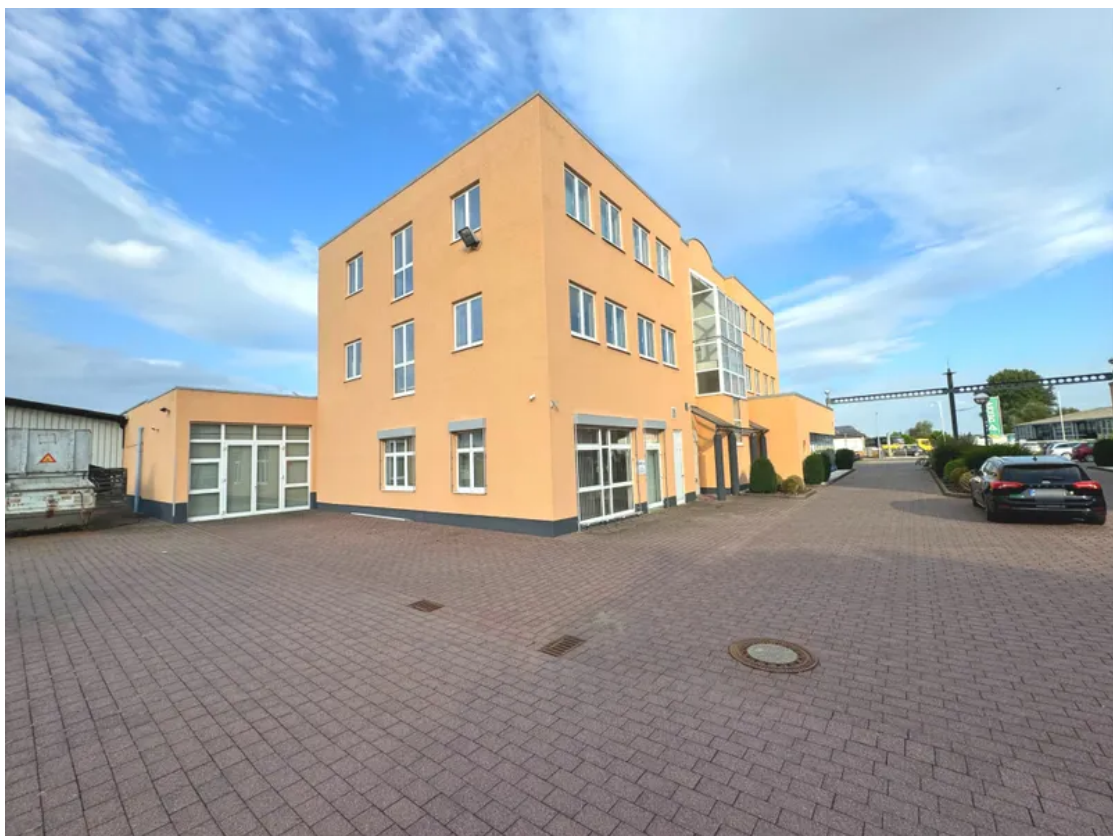
Außenansicht Halle E