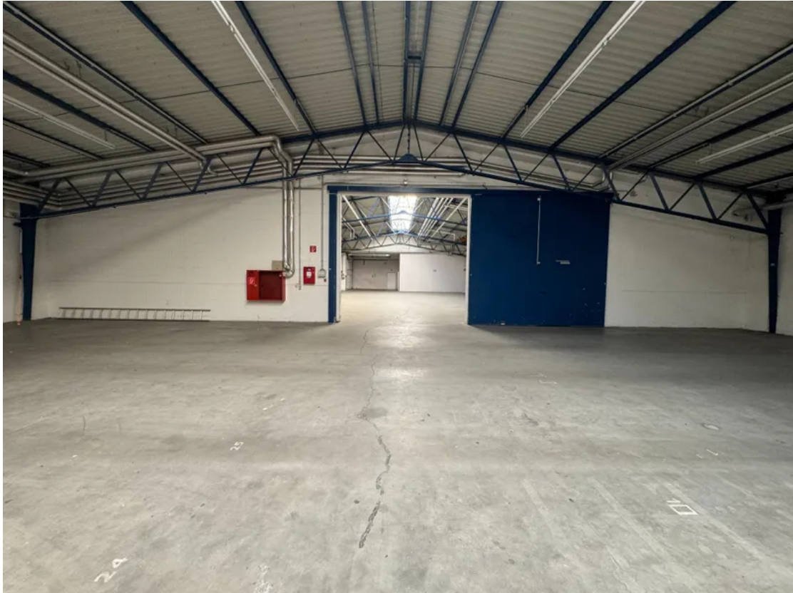
Innenansicht Halle E