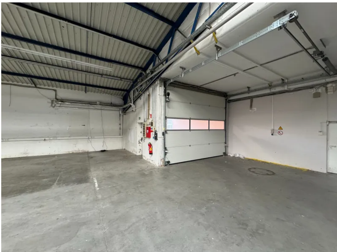
Rolltor Innenansicht Halle E